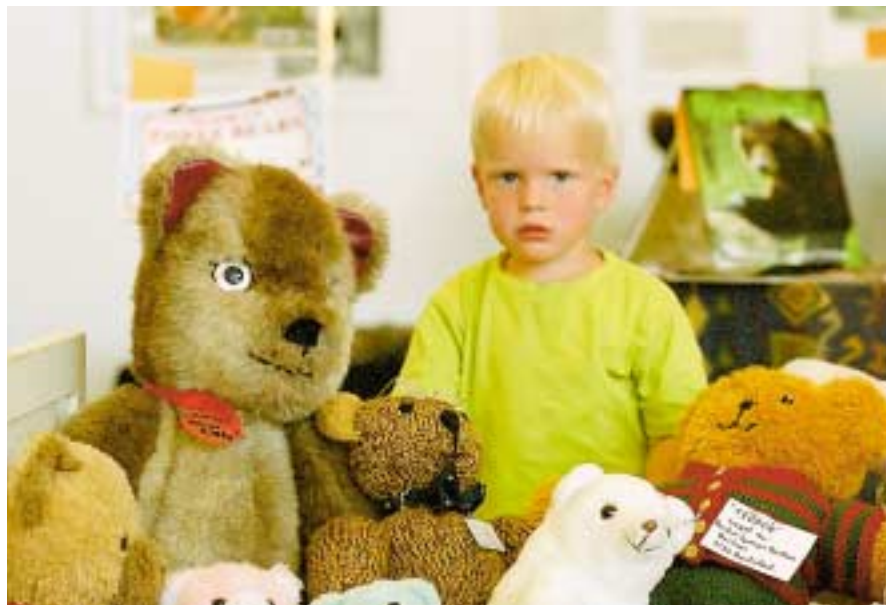
Naturvernforbundet mener at "leve med rovdyr" med fordel kan læres ved hjelp av koserovdyr i tøy og papp.

Når staten blir hovedfinansieringskilde for organisasjonene blir kontakten med grasrota mindre interessant, og ledelse og sekretariat i organisasjonene framstår mer og mer som et «ekstrabyråkrati» for Staten.