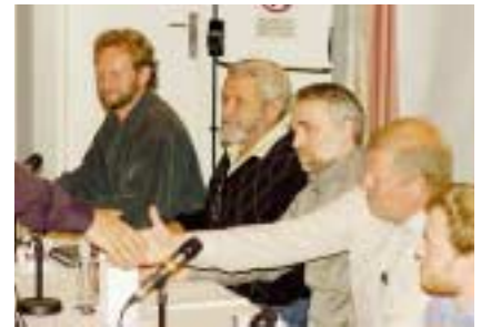
Ulveglass fra Magnor til innlederne.

nevnte spesielt at denne rapporten tilrådde differensiert forvaltning. Videre at det kreves store forvaltningsområder, at det bør tilstrebes lokal medvirkning i forvaltningen og at lokal aksept av forvaltningsstrategien må økes.